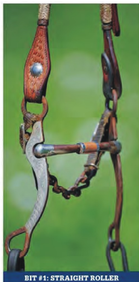
BIT #1: STRAIGHT ROLLER

Czanki: Krótkie, wygięte w tył czanki dają mniejszą dźwignię niż długie i proste, przez co mają etykietkę "łagodnych". Połączenie czanek ze ścięgierzem także sprawia, że to kielzno jest łagodne, szczególnie gdy porównamy je z taki, w którym mocowanie jest stałe. Takie łączenia pozwalają na niezależny ruch czanek. Powoduje to, że ścięgierz drga przy najmniejszym ruchu wodzy, co zachęca konia do rozluźnienia szczęki. Wibracja jest dla niego także sygnałem, że czanki za chwilę zadziałają, co