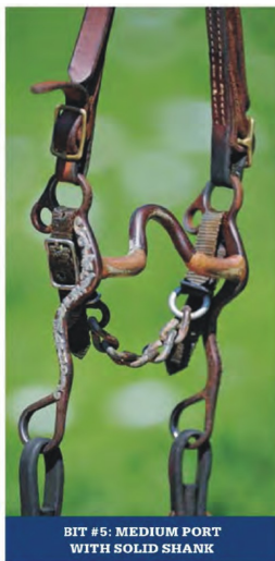
BIT #5: MEDIUM PORT WITH SOLID SHANK

Czanki: To są czanki w tradycyjnym kształcie litery S - taka budowa powoduje, że działamy z mniejszą dźwignią niż przy prostej goleni. To także zmniejsza wielkość napięcia wodzy potrzebnego do tego, by zadziałał łańcuszek lub pasek podbródkowy. I to także powoduje, że gdy odpuszczasz nacisk wodzą, działanie kielzna szybko ustaje. Krótka długość czanek zapewnia łagodniejsze działanie. Jednak brak ruchomych połączeń czanek ze ścięgiem sprawia, że kielzno jest mniej łagodne niż takie samo z ruchomymi częściami. ( Na marginesie: kielzno ze stałymi czankami często może usztywnić krzywego albo myszującego konia nie wywołując u niego jednocześnie strachu).