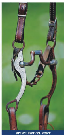
BIT #3: SWIVEL PORT

Dlaczego: Kwadratowy port obraca się po obu stronach na szczycie. Możesz podnieść lewą wodzę i pociągnąć ją do twojego lewego biodra i tylko lewa strona ścięgierza się obróci. To sprawia, że jego działanie młody koń odczuwa bardzo podobnie, jak przy pociągnięciu za wodzę przy wędzidle.