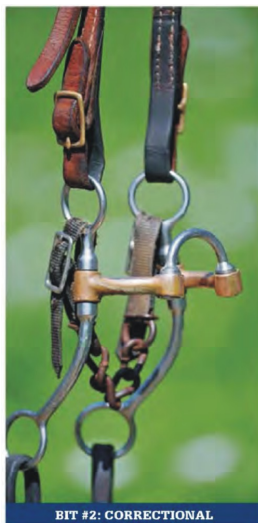
BIT #2: CORRECTIONAL

W dodatku możliwości ruchowe wszystkich części tego kielzna powodują, że pracuje się podobnie jak z treningowym zwykłym wędzidłem, dlatego jest to dobry wybór przy przechodzeniu z wędzidła na pelham. Możesz oddziaływać którąkolwiek stroną kielzna oddzielnie, podobnie jak na wędzidle, więc dla młodego konia odczucia będą znajome. Konstrukcja kielzna zachęca bardziej do relaksu niż do oporu. ( Na marginesie: Ten pelham jest jednym z trzech najlepiej sprzedawanych kielzn w mojej ofercie. Z doświadczenia wiem, że możesz je użyć na 1000 koni i w 990 przypadkach ten pelham im się spodoba).